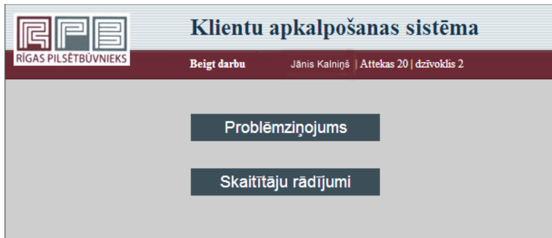
4.attēls: Izvēlnes ekrāns

Pēc spiedpogas Saglabāt nospiešanas tiks atvērts izvēlnes ekrāns: